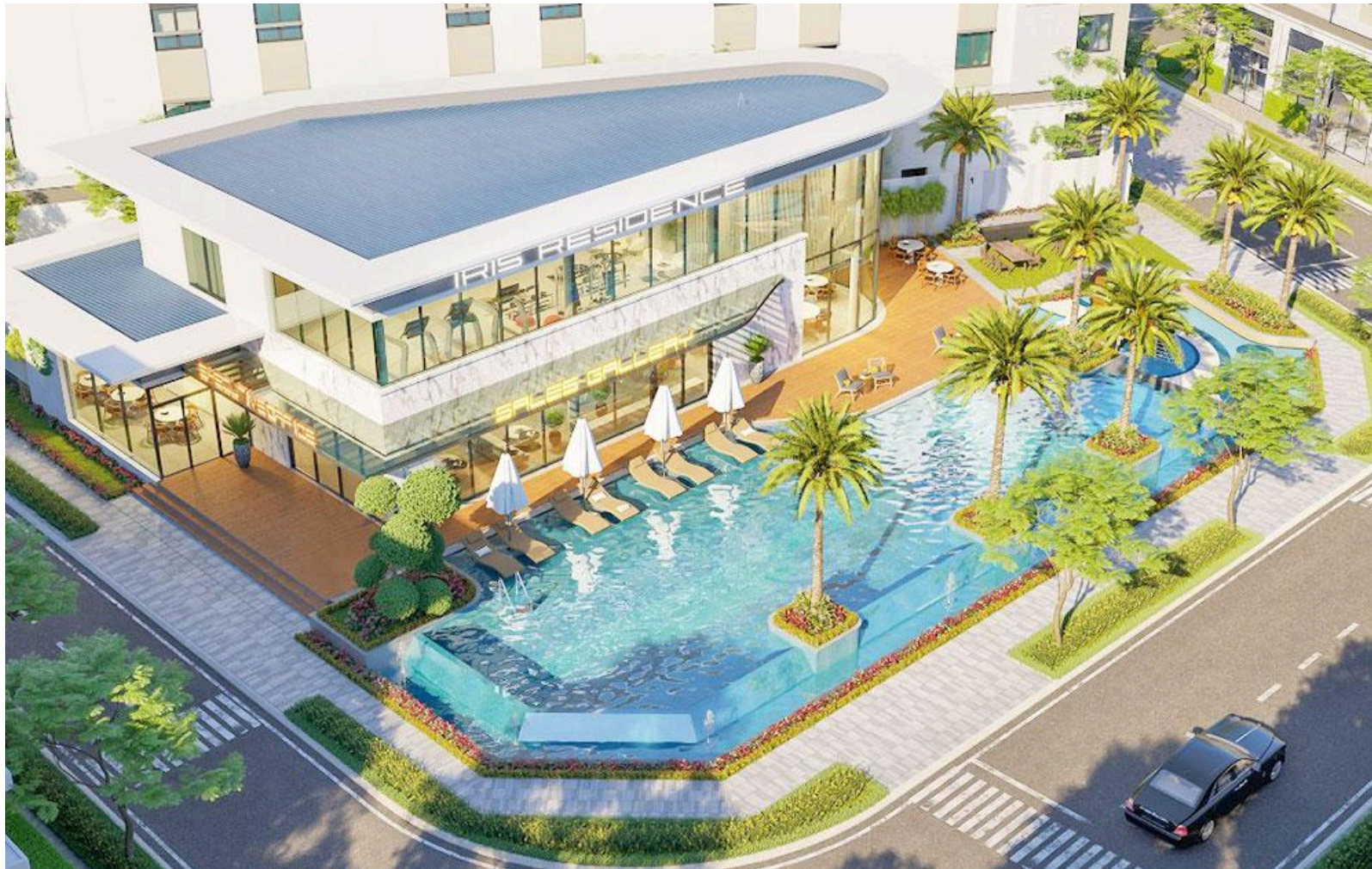
Khu dân cư kiểu

mẫu- Chuẩn sống mới tại Long An của Iris Land