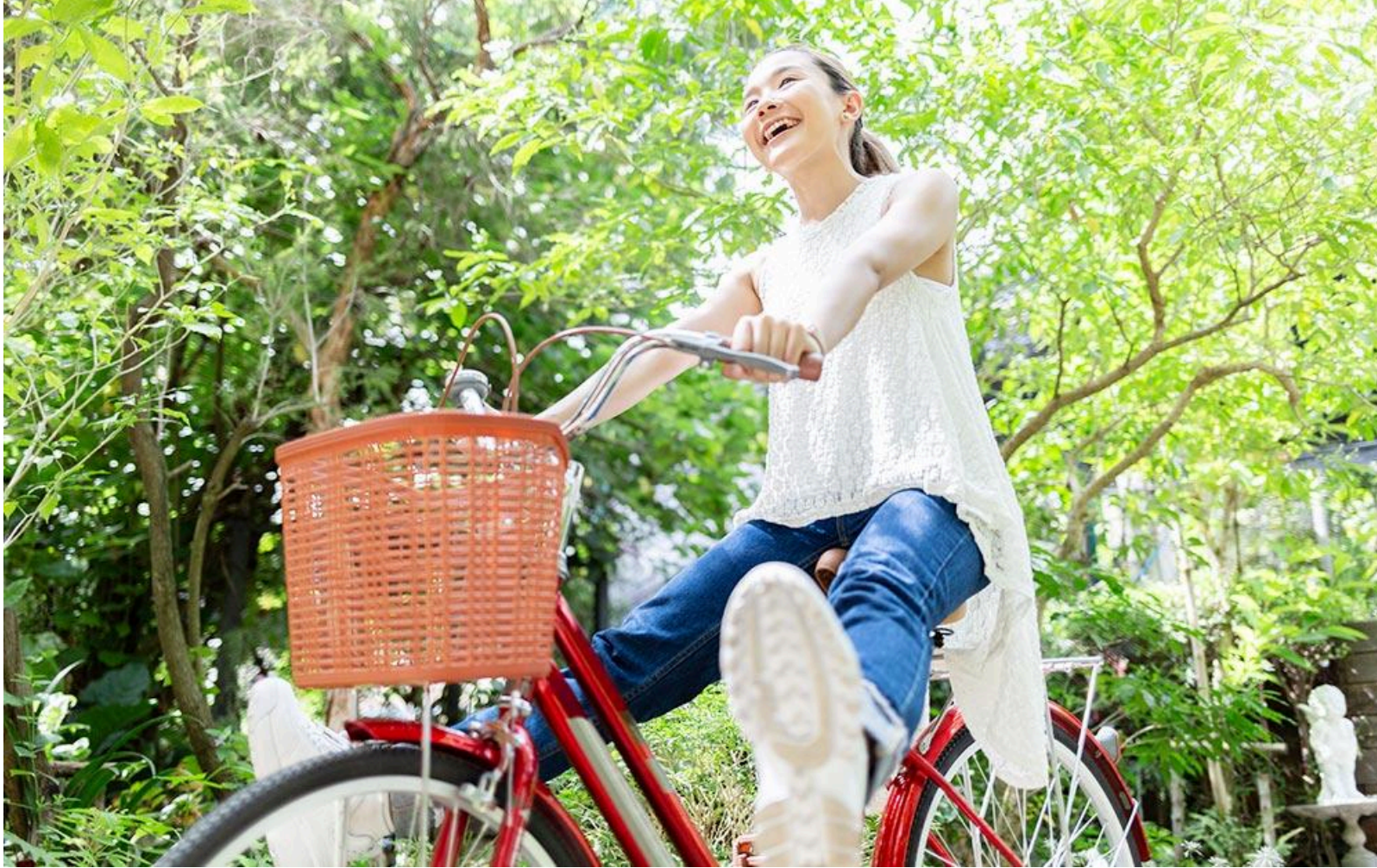
Môi trường xanh