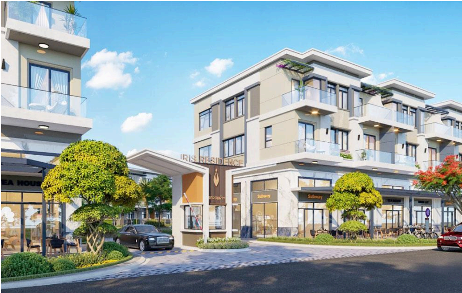
Lối vào khu nhà

Nhà là nơi để nghỉ ngơi và thư giãn, cư dân của khu nhà ở biệt lập Iris Residence được chào đón bởi thiên nhiên thanh bình ngay tại lối vào dự án.