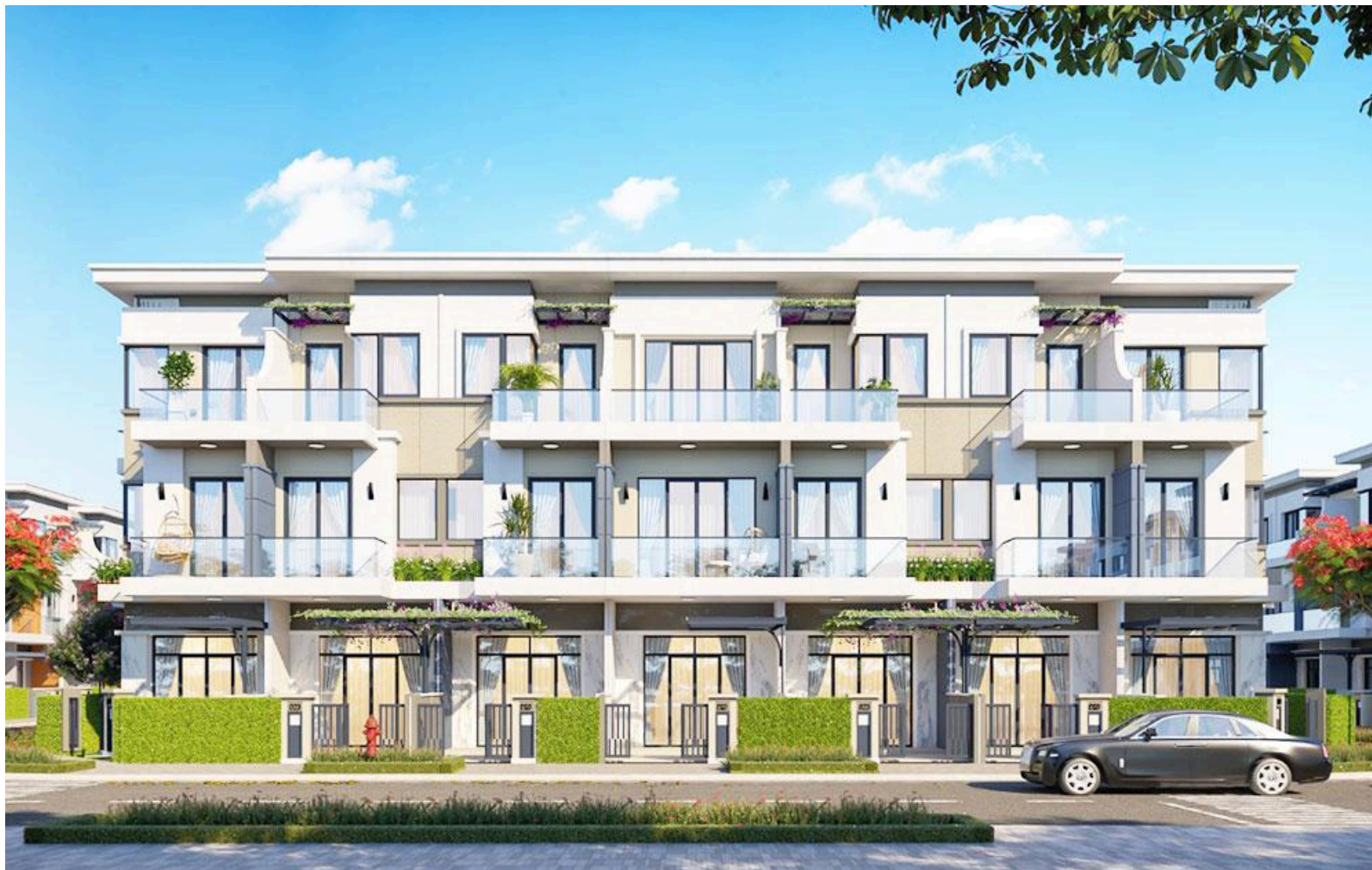
Khu nhà ở