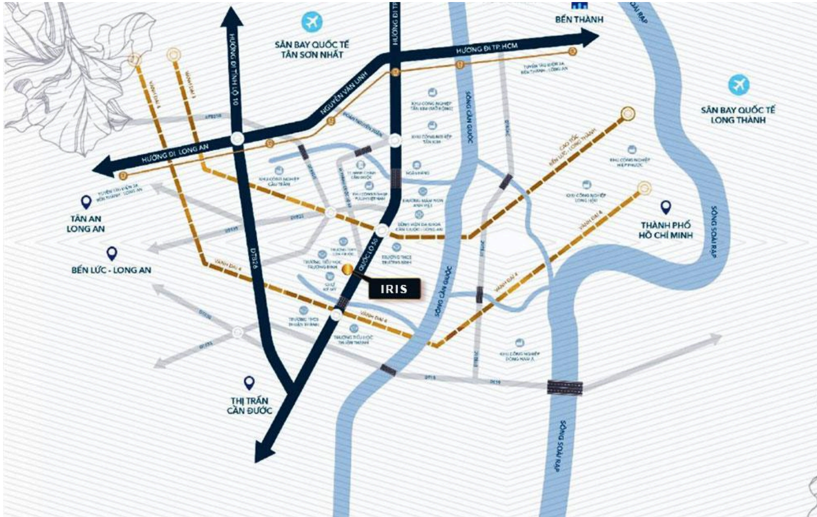
Vị trí dự án của