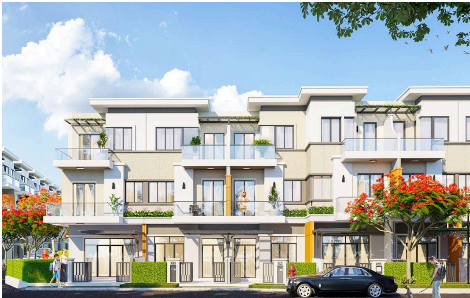
Nhà phố Iris