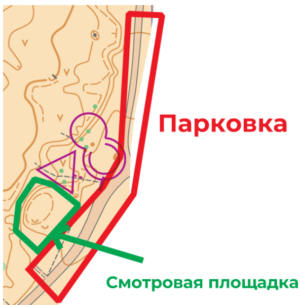
Схема арены: смотровая площадка, парковка, старт, финиш и последний КП

Координаты: https://maps.app.goo.gl/ey99eBV3La3hB34V7 (47.377646, 28.833899)