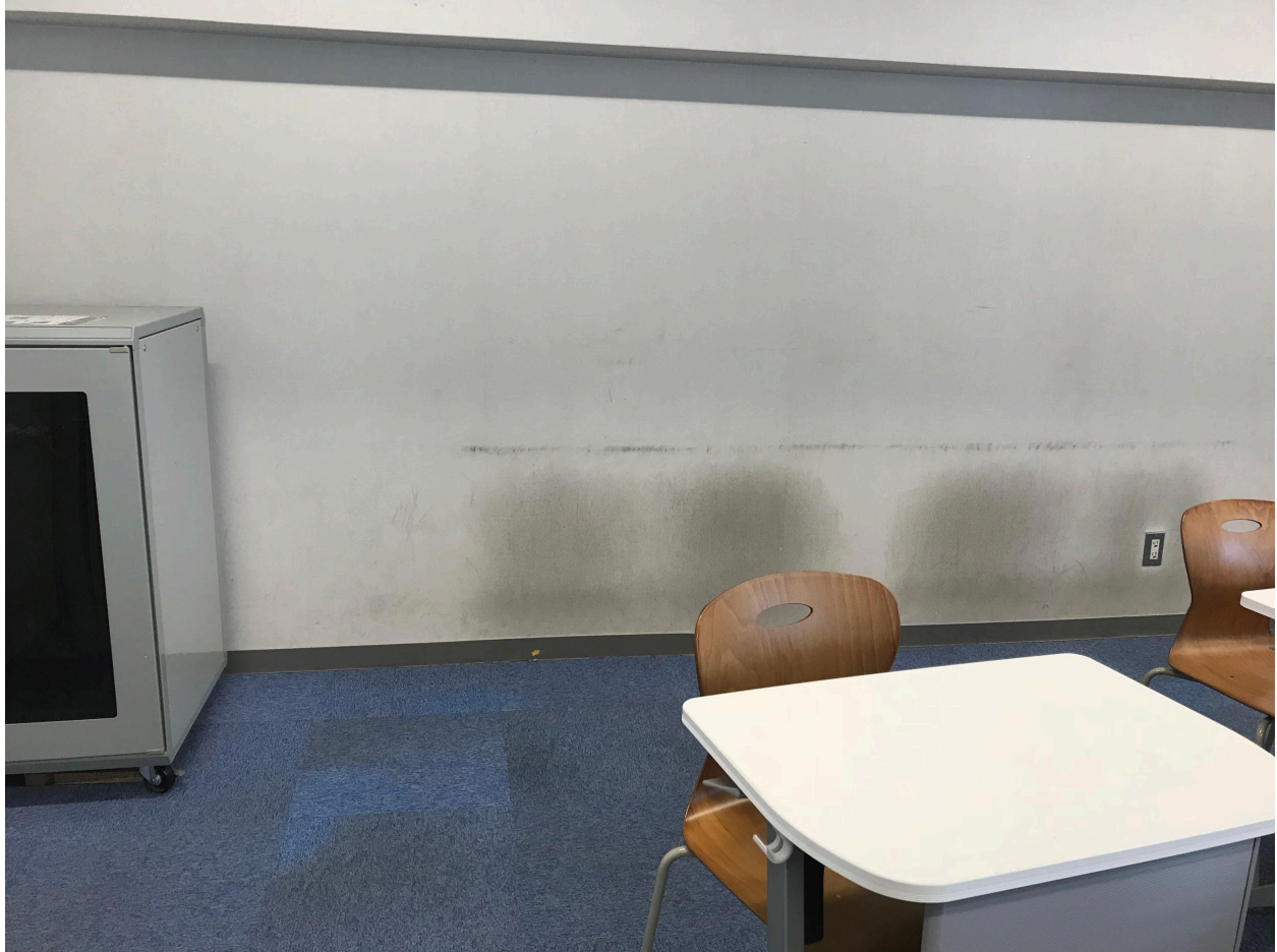
Unusable Space such as in 215 and 311. 使い方のわからないスペースがある 例:215教室、311教室