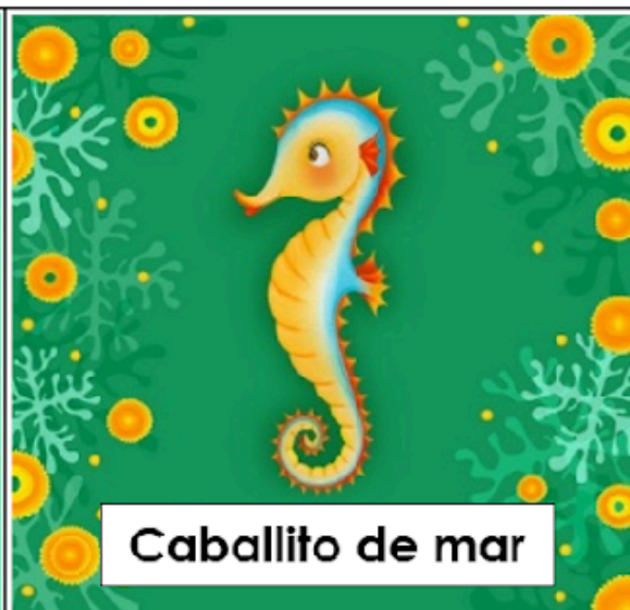
Caballito de mar

No lo parezco y soy pez, y mi forma recuerda a una pieza de ajedrez.