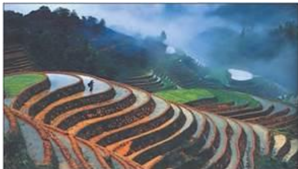
Мал. 1. Рисові терасові поля на схилі гори Хребет Дракона (Китай).

Клімат також неоднорідний. Північні райони Китаю та Монголії зайняті тайговими лісами, на окремих ділянках навіть поширена багаторічна мерзлота. На крайньому півдні в Індонезії та Малайзії простягаються вологі екваторіальні ліси, а температура повітря рідко опускається нижче +25 °С. При просуванні в глиб материка клімат стає більш континентальним. В Азії розташовано декілька великих пустель (Руб-ель-Халі в Саудівській Аравії, Гобі в Монголії та Китаї). Водночас тут є найвологіше місце на планеті: у передгір'ях Гімалаїв випадає понад 11000 мм (11 м!) опадів за рік.