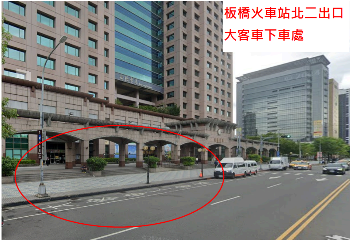
板橋火車站北二出口 大客車下車處