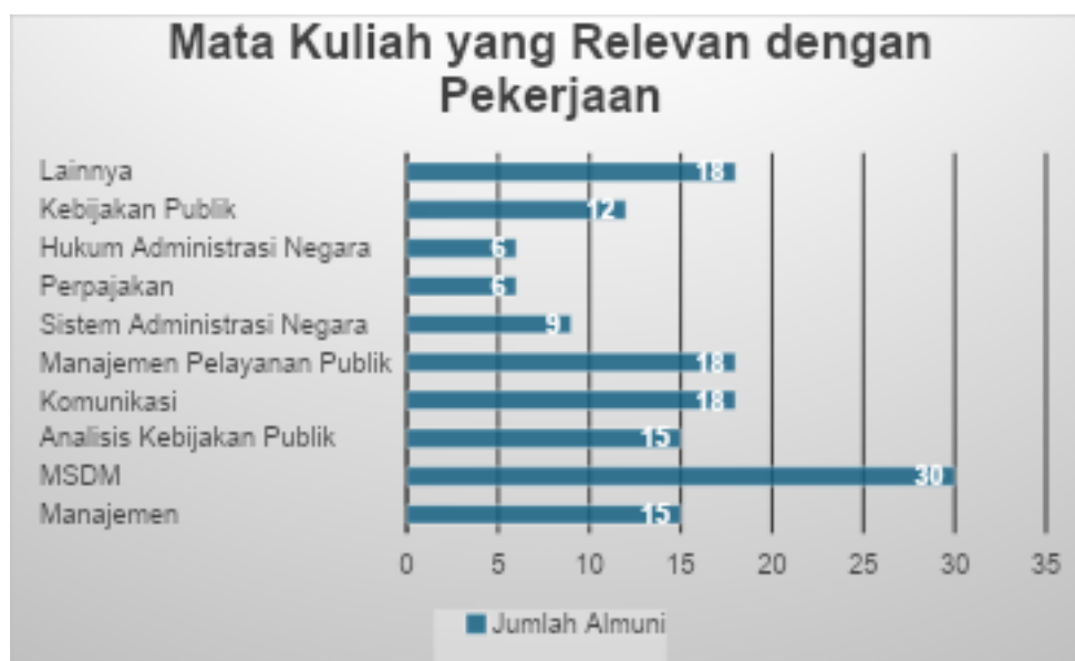
Gambar 2. Mata Kuliah yang Relevan dengan Pekerjaan

Ada banyak mata kuliah yang ditawarkan oleh Prodi Administrasi Publik. Menurut alumni, mata kuliah yang telah ditawarkan dan mendukung pekerjaan alumni adalah Manajemen Sumber Daya Manusia (MSDM), Manajemen Pelayanan Publik, Komunikasi, Manajemen, dan Analisis Kebijakan Publik. Selain mata kuliah yang telah ditawarkan, alumni juga merasa perlu adanya mata kuliah – mata kuliah baru yang belum ditawarkan dalam kurikulum Prodi Administrasi Publik. Mata kuliah ini perlu ditawarkan karena relevan dengan profil lulusan dari Prodi Administrasi Publik. Beberapa mata kuliah yang disarankan oleh alumni adalah Kearsipan, Akuntansi Dasar, Manajemen Resiko, dan Manajemen Aset.