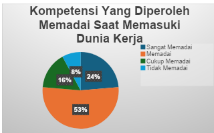
Gambar 1. Kompetensi yang Diperoleh Memadai saat Memasuki Dunia Kerja

Kompetensi yang didapatkan lulusan Prodi Administrasi Publik sudah sesuai dengan dunia kerja. Hal ini dibuktikan dengan hasil tracer study , dimana 52 % responden menjawab telah memadai. Detail jawaban dari lulusan dapat dilihat dalam diagram berikut.