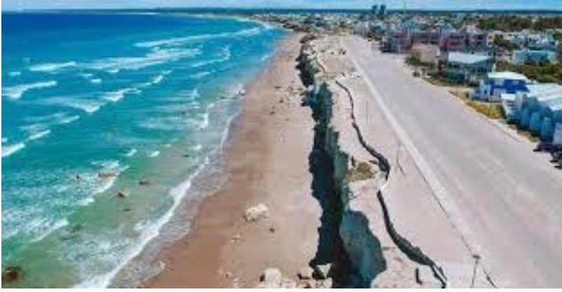
Imagen 1) Las Grutas, provincia de Rio Negro