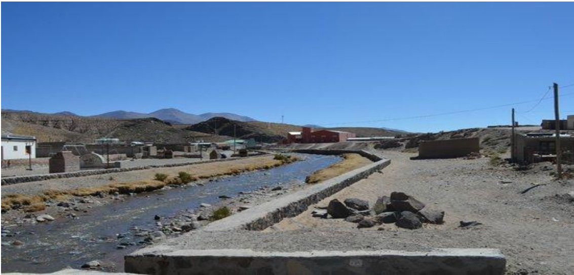
Imagen 2) San Antonio De los Cobres, provincia de Salta.