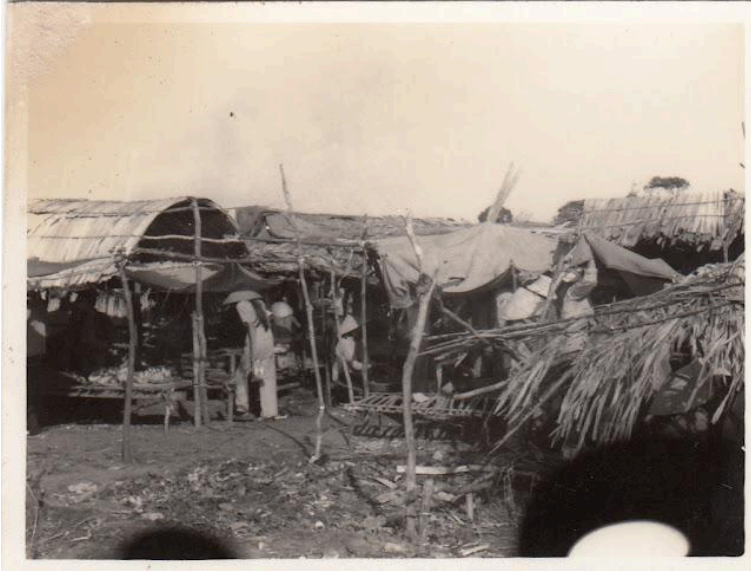
Chợ tạm cư mái tranh vách lá cho đồng bào QT 1973 tại Hòa Khánh Đà Nẵng

Nhắc lại đám cựu học sinh Nguyễn Hoàng trong đám tòng quân sau Mùa Hè 1972 chán khối. Mặt tụi nó hết 'búng ra sữa', khá xạm đen theo nắng thao trường một ít thôi. Nhất là đầu tóc hai 'xăng ti mét', cái mũ bê-rê đội nghiêng trên đầu, hai 'con cá vàng' trên cổ áo, đôi giày lính đánh 'xi ra' đen bóng. Tất cả gom lại, trông thật oai vệ. Chỉ hơn nửa năm trời, nhưng đố ai nhìn ra?