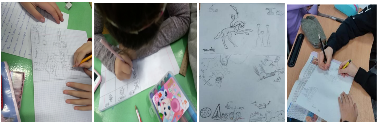
Фото 2. Створення коміксу Фото 3. Створення піктограми

Для кращого усвідомлення матеріалу використовую на уроці творчі форми роботи - це створення коміксів (Фото 2) та піктограм (Фото 3).