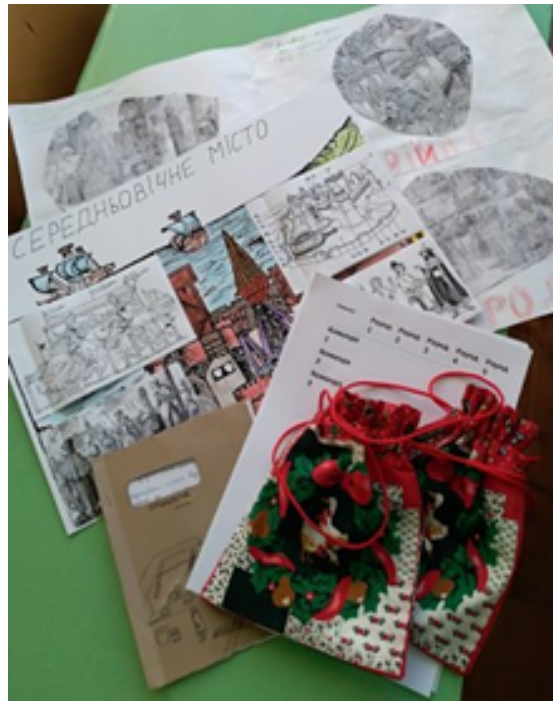
Фото 1. Приклади виконаних ігор учнями

Для кращого усвідомлення матеріалу використовую на уроці творчі форми роботи - це створення коміксів (Фото 2) та піктограм (Фото 3).