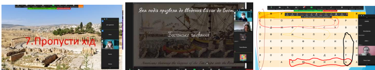
Фото 4. Ігрові форми роботи під час дистанційного навчання

Попри обмеження в часі, санітарні норми, ігрові моменти на уроках залишаються і в дистанційній формі роботи. (Фото 4)