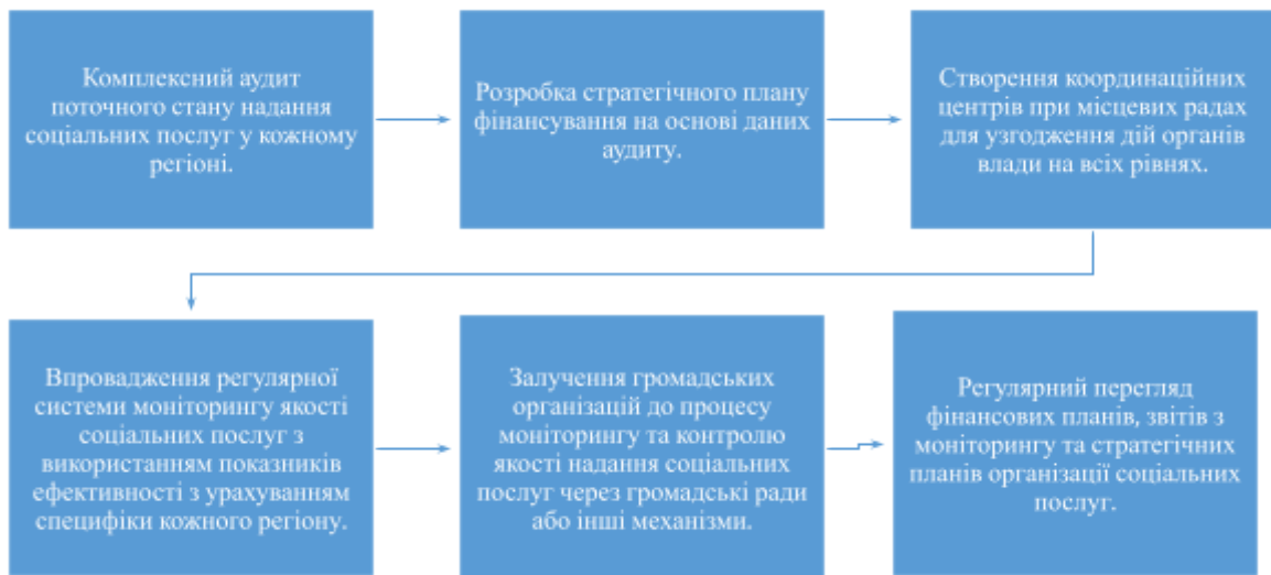
Рис. 1. Алгоритм удосконалення механізмів фінансування, організації та моніторингу соціальних послуг на місцевому рівні в умовах сучасних викликів