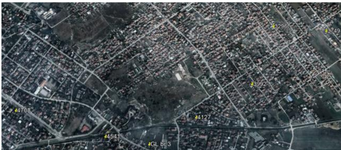
Слика 3- Локација на објектите од ЛОТ 3 - Google Earth