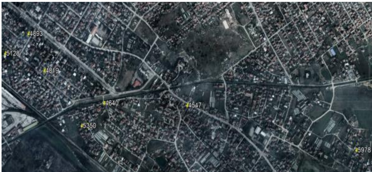
Слика 2 - Локација на објектите од ЛОТ 2 - Google Earth

Локацијата на објектите од ЛОТ 2 по Катастерска Парцела се прикажани на сликата 2 подолу.