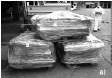
Слика 6 - одлагање на демонтираните салонит плочи

Изведувачите на демонтажни работи на кровот да ги отстранат брановидните и други покривни и фасадни азбестни панели, на таков начин што нема да ги скршат или оштетат панелите и мора да се наредени на палети и завиткани во фолија со дебелина најмалку од 0,4 mm (слика 6), а скршените парчиња мора да се соберат одделно во контејнери или вреќи во кои горниот слој да е покриен со земја (слика 7) за да се спречи можно ширење на прашина.