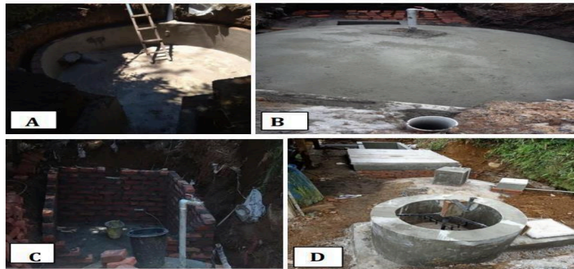
Gambar 1. (A) Digester Casting; (B) Methane Gas Reservoir Installed by Faucet; (C) Making Cow Final Manure Shelter; (D) Communal Biogas with Final Disposal Sites

Jurnal versi cetak dicetak dengan warna hitam putih, penulis sebaiknya menyesuaikan gambar dengan kondisi tersebut. Contoh peletakan serta penamaan gambar seperti pada Gambar 1, dan contoh menampilkan diagram pada Gambar 3.