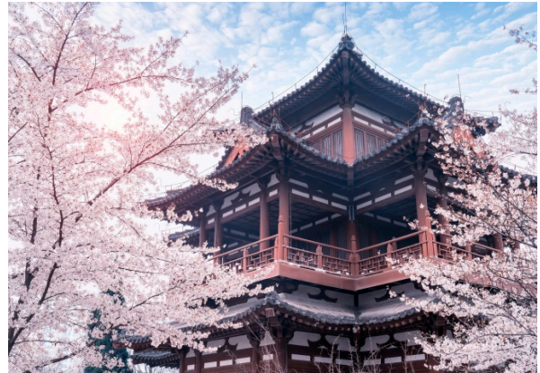
Chùa Thanh Long

Đoàn ăn sáng tại nhà hàng. Sau bữa sáng, đoàn làm thủ tục trả phòng. Đoàn khởi hành tham quan: