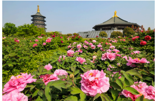
Mùa hoa mẫu đơn (Cuối T3 & T4)

Đoàn ăn sáng tại nhà hàng khách sạn. Sau bữa sáng, đoàn làm thủ tục trả phòng di chuyển nhà ga trung tâm Tây An trải nghiệm tàu cao tốc 350km/h sang thành phố Lạc Dương ( Dự kiến: G1712 0825/0949 ). Đoàn tiếp tục tham quan: