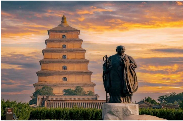
Tháp Đại Nhạn