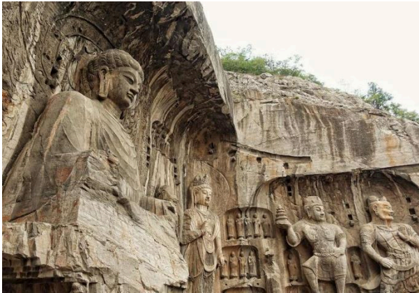
Hang đá Long Môn