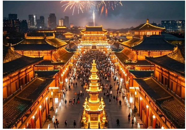
Chùa Thanh Long

Đoàn nhập cảnh vào Tây An. Xe và HDV đưa quý khách đi nhà hàng địa phương ăn trưa. Di chuyển về khách sạn nghỉ ngơi.