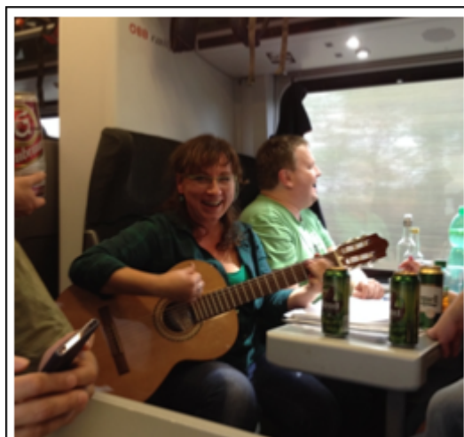
K jízdence živá produkce zdarma. Vlevo jeden z producentů Gambrinus.

Po nástupu do vlaku z Prahy do Brna jsme začali podezřívát České dráhy, že v rámci rozšiřování svých služeb teď do RailJetů zkušebně zařazují tzv. hlučný oddíl. Do vagonu se k nám nahrnula parta asi patnácti rozjívených ajznbůňáků. Na rozdíl od toho Nohavicova smutného, co pil na pátém nástupišti eierkoňak, tihle byli již od počátku nadmíru veselí a směřovali do vinného sklepa. Ještě před usednutím (někteří neusedli vůbec a nebezpečně nad námi povlávali) se zčerstva jali vytahovat mnóstwo piw a lahve s obsahem různých barev, z nichž by kdejaký tým radostně složil duhu nebo přinejmenším semafor . Jádrem tohoto bardzo fajnego kolektywu , tedy kytara s nejmýraznějšími „zpěváky“, se usadilo přímo naproti přes uličku. Začali pozvolna, Klusem, ale pak už se nezadržitelně řítili trapem napříč žánry. S invencí sobě vlastní dokázali přetavit tradiční lidové i popové pecky ve velmi intenzivní zážitek (brrr).