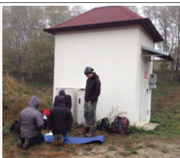
Zmrzli poTrati u trati modlíci se za brzké prolomení.