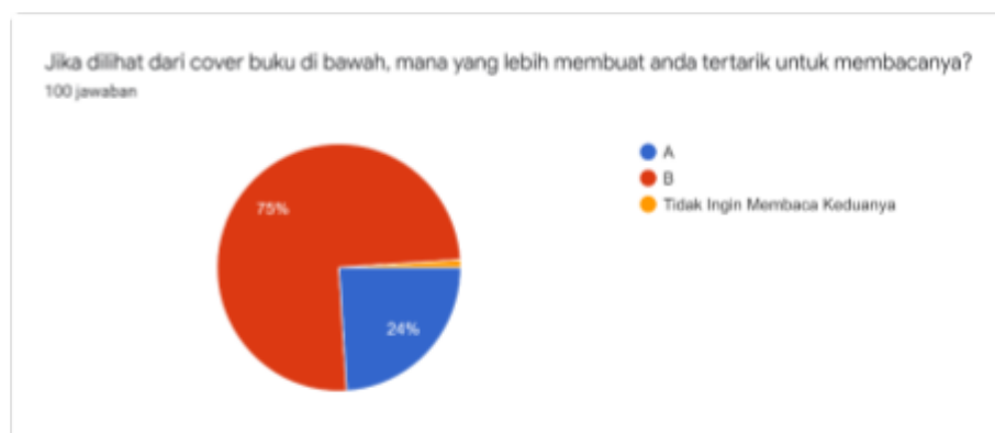
Gambar 11. Persentase jawaban responden (3)