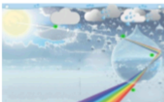
Gambar 2. Data acuan visual.