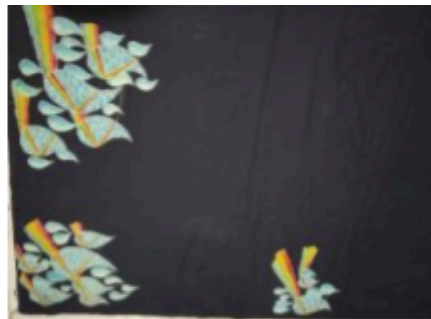
Gambar 1. Hasil akhir setelah proses pelorodan Karya 1.

Foto ilustrasi (jika ada) dikirimkan dalam format JPEG ukuran 300 DPI dengan dilengkapi keterangan foto yang jelas. Sumber gambar/foto/ilustrasi ditulis lengkap dengan tahun pengambilan. Keterangan pada gambar/foto/ilustrasi diketik dengan tipe huruf Times New Roman ukuran 10 dengan spasi 1/tunggal dan posisi di tengah (center). Artikel diketik tegak atau miring/ italic , sesuai dengan bahasa yang digunakan. Penulisan keterangan diakhiri dengan tanda titik. Penulisan kata Gambar/Foto/Illustrasi harus diberi nomor dan tidak boleh disingkat, misalnya: Gb.1 . Disarankan penggunaan kotak teks dalam kasus ini. Usahakan, gambar/foto/ilustrasi bukan merupakan hasil dokumentasi proses penelitian dari penulis tetapi merupakan objek penelitian. Contoh foto ilustrasi seperti pada Gambar 1, dst.