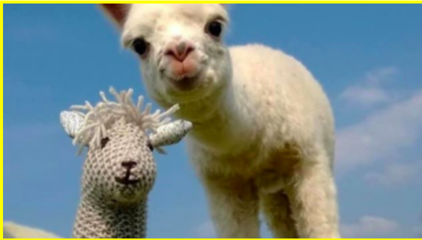
GUNNHILD MED PONNIEN!!