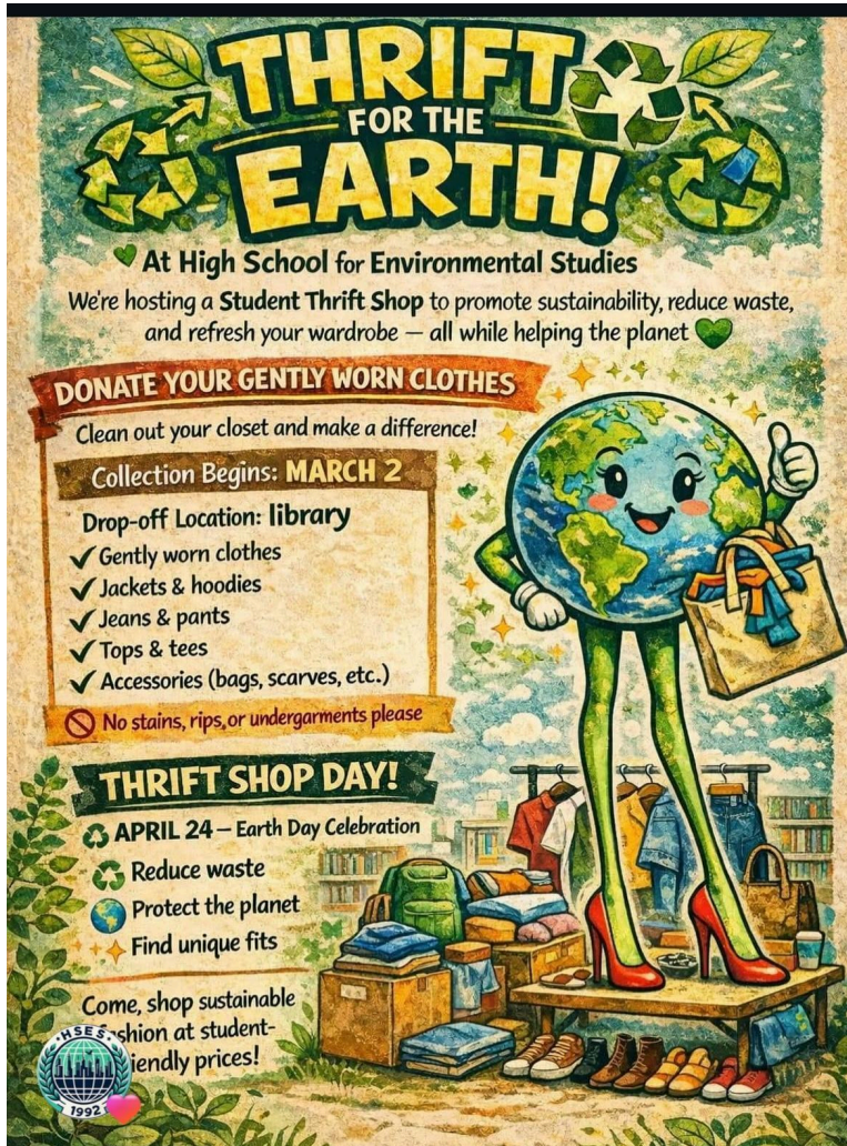
Thrift Shop Information Flyer