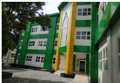
Gambar 1. Contoh Gambar

Bagian simpulan jawaban atas hipotesis, tujuan penelitian dan temuan penelitian serta saran terkait ide lebih lanjut dari penelitian. Simpulan disajikan dalam bentuk paragraf. Hal penting lainnya tentang bagian ini adalah (1) jangan menulis ulang abstrak; (2) tidak menyampaikan argumen, bukti, ide baru, atau informasi baru yang tidak terkait dengan topik; (3) tidak menyertakan bukti (kutipan, statistik, dll.) yang sudah ada pada pembahasan.