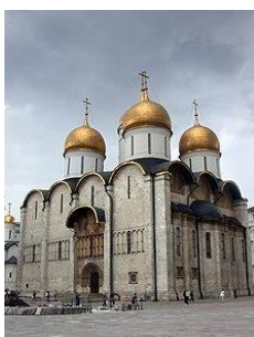
1. Успенский собор в Московском Кремле