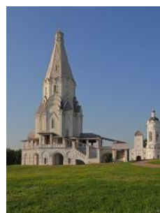
3. Церковь Вознесения Господня в Коломенском (Москва)