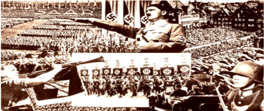
Fotograma de El triunfo de la voluntad, película dirigida por Leni Riefenstahl