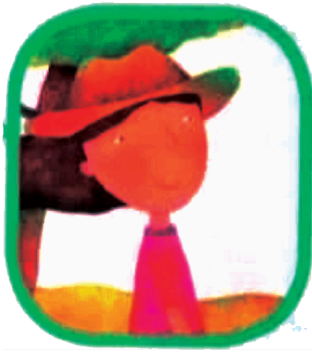
Camila, Niña del Llano

En el colegio extraño a mi caballo En esta inmensa sabana que son los Llanos Orientales los lugareños se sienten libres cabalgando por un territorio donde hay garceros y morichales. Allí los ríos se desbordan en invierno y el agua se evapora en verano; se rezan las culebras y el ganado.