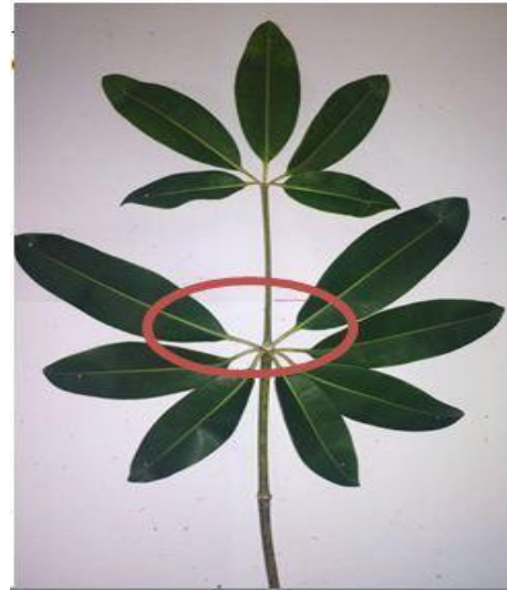
Gambar 1. Nama Gambar

dilakukan dijabarkan dalam bab ini ditunjang oleh data-data yang memadai. Selain itu, harus dijelaskan keterkaitannya dengan konsep-konsep yang sudah ada serta perbandingannya dengan penelitian-penelitian sebelumnya, apakah hasil penelitian sesuai atau tidak, menjadi lebih baik atau tidak dan aspek lainnya.