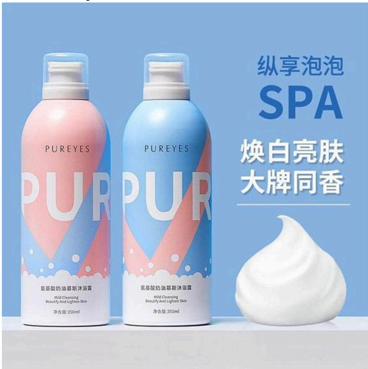
Sữa tắm trắng da Havana body