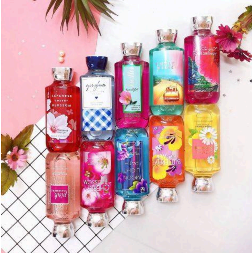
Sữa tắm thơm lâu