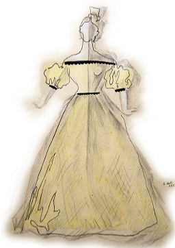
CENTRO EUROPEO DE MUJERES MARIANA PINEDA