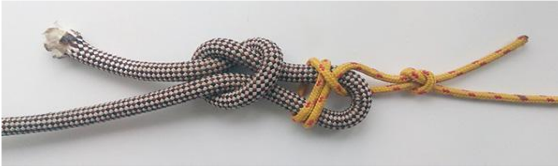
4. Зустрічна вісімка