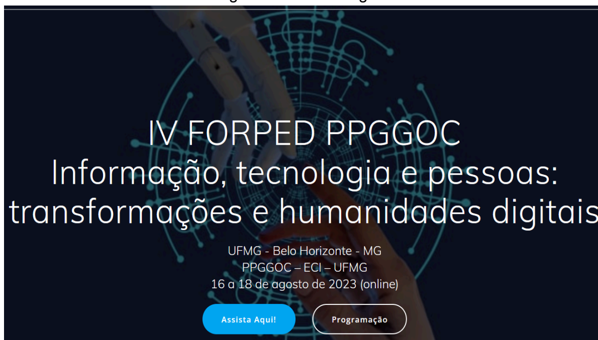
Figura 1: Título da figura

Recomenda-se o uso moderado e somente quando houver a necessidade de utilização de figuras, gráficos, ilustrações e/ou tabelas. Indica-se que essas representações visuais devem ser apresentadas com boa resolução para que seja possível visualizá-las com facilidade. Além disso, devem possuir título e fonte, conforme os exemplos a seguir: