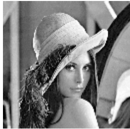
Gambar 1 Citra lena.bmp