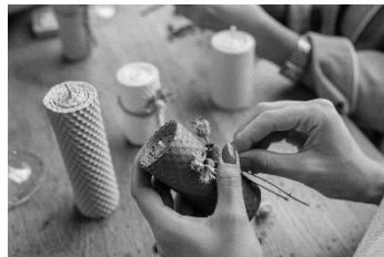
Gambar 1. Proses Pembuatan Kerajinan

Gambar yang dicantumkan pada naskah harus dengan kualitas yang baik. Gambar tidak berdiri sendiri dan harus merupakan bagian yang relevan dari naskah. Agar diperhatikan bahwa gambar bukan merupakan dokumentasi yang tidak terkait dengan pembahasan naskah. Pastikan naskah tidak menampilkan gambar yang menunjukkan identitas maupun afiliasi para penulis.