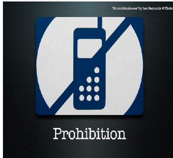
Illustration by Belshaw in Flickr

Here are the musts to work with arabARe: