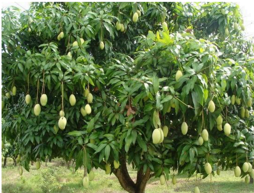
Hình 2. Hình ảnh cây xoài cát Hòa Lộc

Xoài là cây ăn quả nhiệt đới, phần lớn các tác giả đều cho rằng nguồn gốc cây xoài ở miền Đông Ấn Độ và các vùng giáp ranh như Miến Điện, Việt Nam, Malaysia.