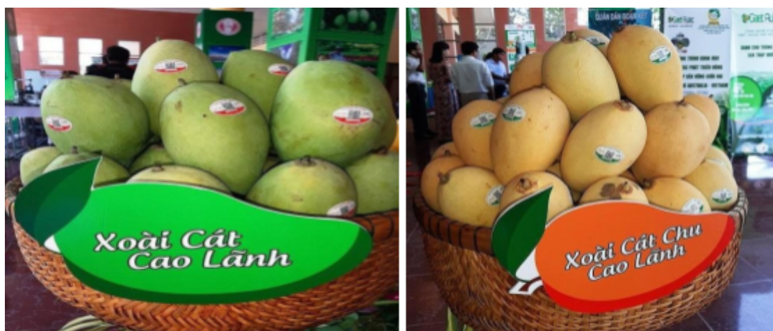
Hình 4. Hình xoài thương hiệu “ Xoài Cao Lãnh” và thương hiệu “ Xoài Cát Chu Cao Lãnh” theo tiêu chuẩn GlobalGAP và theo tiêu chuẩn VietGap.

Huyện Cao Lãnh được gọi là “vương quốc của Xoài” và là một trong những địa phương đứng đầu cả nước về diện tích trồng xoài với hơn 9.200 ha trong tổng số 5.598 ha diện tích cây ăn trái trên toàn huyện. Trong đó, trồng nhiều nhất là xoài cát Chu và xoài cát cùng loại với xoài cát Hoà Lộc với sản lượng ước tính khoảng 30.000 tấn xoài/năm. Xoài Cao Lãnh từ lâu đã là loại trái cây đặc sản nổi tiếng của tỉnh Đồng Tháp. Nhiều năm qua, xoài Cao Lãnh được đánh giá cao trên thị trường tiêu thụ do chất lượng cao và ổn định. Tại các cuộc thi trái ngon vùng ĐBSCL, xoài Cao Lãnh luôn chiếm được những giải thưởng cao.