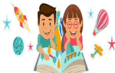
Gambar 1. Pentingnya Manajemen Pendidikan Bagi Anak-anak