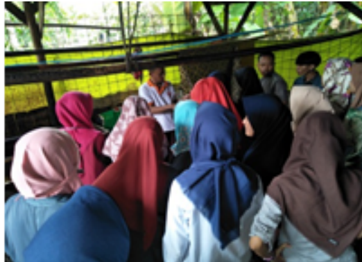
Gambar 1. Kegiatan Eksplorasi Mahasiswa PGSD di Sentra Batik Ciwaringin