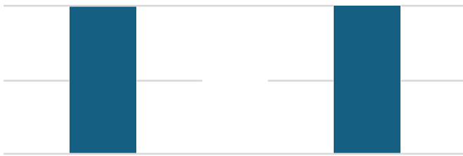
Gambar 2. Histogram Rasa Minuman Kombucha

minuman kombucha yang rendah sebesar 3,33. Histogram warna minuman kombucha dapat dilihat pada Gambar 2.