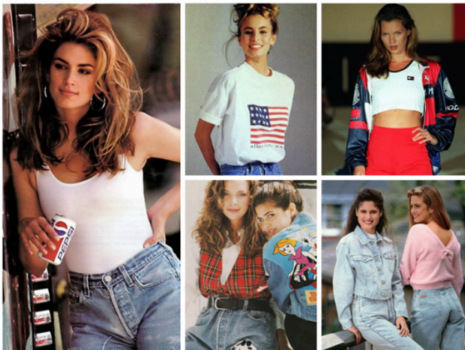
Американский стиль 90х годов