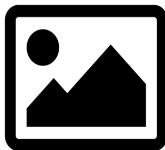
Figure 1. Ini adalah gambar. Skema mengikuti format yang sama.

Semua gambar dan tabel harus dikutip dalam teks utama seperti Gambar 1, Tabel 1, etc.