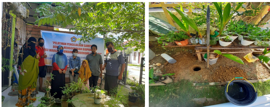
Gambar 1: Pelaksanaan Pelatihan Pembuatan Biopori di Rumah Warga

Pembahasan berurut sesuai dengan urutan dalam tujuan, dan sudah dijelaskan terlebih dahulu. Pembahasan disertai argumentasi yang logis dengan mengaitkan hasil PkM dengan teori, hasil PkM yang lain dan atau hasil penelitian.