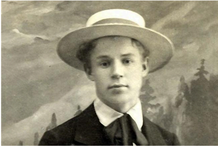
Сергей Есенин в юности