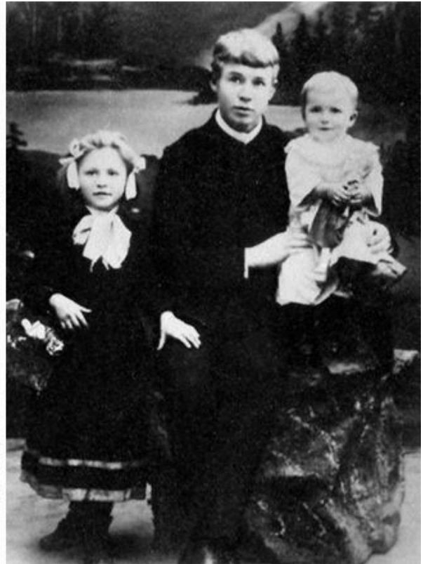
Сергей Есенин с родителями и сестрами

Еще одним поводом для разлада в семье стало то, что после переезда отца в Москву мальчик стал жить у своего родного деда-старообрядца, отца матери. Именно там он получил мужское воспитание, которым на свой лад занимались сразу три его дяди. Так как они не успели обзавестись своими семьями, то старались уделить мальчику много внимания.