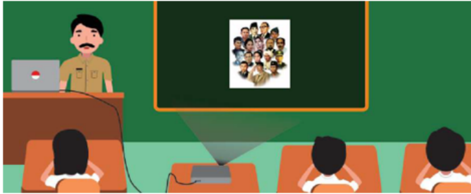
Gambar 2.9 Guru Menampilkan Foto Pahlawan