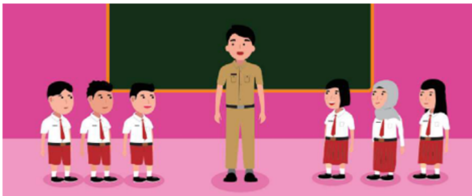
Gambar 2.8 Guru Memberi Kesempatan