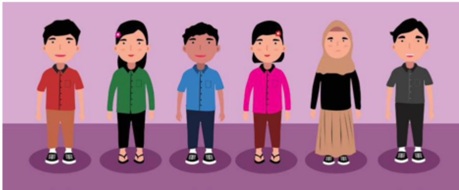
Gambar 2.14 Hidup Bermasyarakat

Manusia memiliki kebutuhan dan keinginan yang berbeda-beda. Selama kalian hidup berdampingan dengan manusia lain, kalian akan selalu membutuhkan norma untuk memelihara hubungan antar sesama dan mencegah benturan kepentingan yang diakibatkan karena kebutuhan dan keinginan masing-masing individu. Bangsa Indonesia sebagai bangsa yang berbudi luhur sangat menjunjung tinggi norma dalam kehidupan bermasyarakat. Norma pada hakikatnya merupakan kaidah hidup berupa tuntunan tingkah laku manusia dalam hidup bermasyarakat.