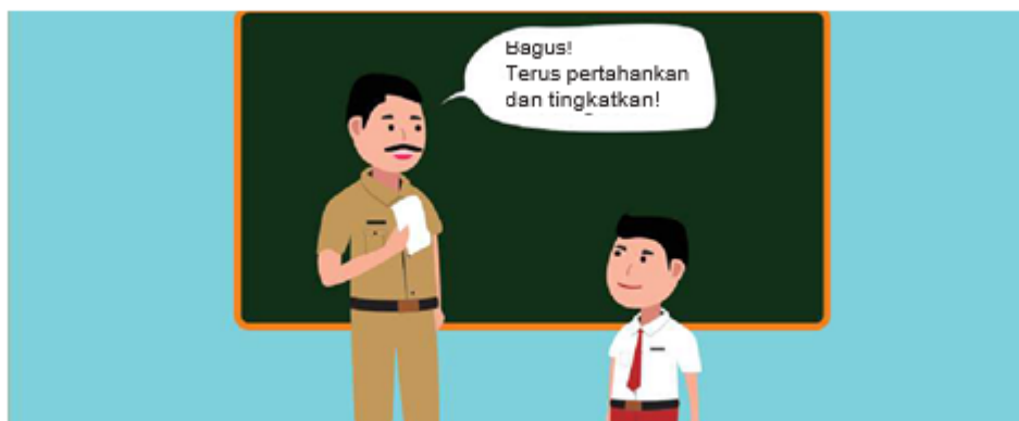
Gambar 2.10 Guru Mengapresiasi