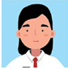
Gambar 2.12 Peserta Didik

Halo, pesertadidikSDKelas V, pada kegiatan pembelajaran ini kalian diharapkan dapat menuliskan beberapa tokoh yang kalian kagumi. Setelah itu, kalian diharapkan dapat menuliskan perilaku dari tokoh tersebut yang dapat kalian teladani. Tuliskan nama tokoh beserta keteladannya pada tabel di bawah ini. Selamat beraktivitas!