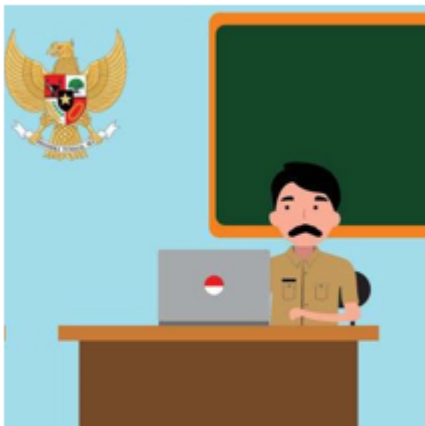
Gambar 2.8 Guru Mempersiapkan Pembelajaran

Kita patut bersyukur kepada Tuhan Yang Maha Esa karena sudah diberikan anugerah berupa kesempatan untuk hidup dengan cara mentaati seluruh perintah Nya dan menjauhi larangan-Nya sebagai bentuk sikap beriman dan bertakwa kepada Tuhan Yang Maha Esa. Manusia sebagai makhluk individu akan berpikir dan bertindak berdasarkan kehendak dirinya, namun perlu diingat bahwa manusia merupakan makhluk sosial, yang juga dituntut untuk menghargai keberadaan orang lain.