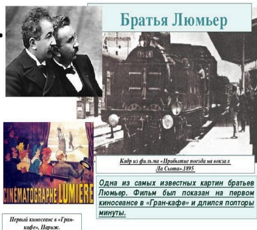
Первый кинотеатр в «Гран-кафе», Париж.

Первый фильм появился во Франции и назывался он «Прибытие поезда». Его создателями были братья Люмьер.