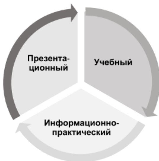
Рис. 1. Компоненты образовательной экспедиции

5. Рисунки для статьи должны быть чётко выполненными, хорошего качества, наглядно иллюстрирующими текст. Нумерационный заголовок набирается курсивом и располагается внизу рисунка справа. Тематический заголовок следует помещать над рисунком без точки в конце с выравниванием по центру. Рисунок необходимо располагать после текста, в котором она упоминается впервые, или на следующей странице. Ссылка на рисунок в тексте обязательна – она должна находиться до момента представления самой таблицы. Если рисунок имеет большой формат, он должен быть помещён на отдельной странице, в случае значительной ширины – на странице с альбомной ориентацией.