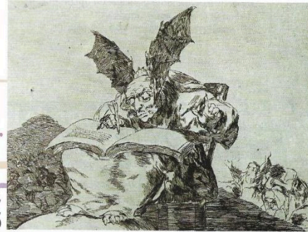
Francisco de GOYA Y LUCIENTES (pintor español), estampa n° 71 de la serie Los desastres de la guerra , 1814-1815 (Crítica a las leyes de Fernando VII)

una alegoría • un ataque • las garras • las leyes • los poderosos • el pueblo • injusto(a) • monstruoso(a) • animalizar • caricaturizar • favorecer • perjudicar • redactar • ser crítico(a) con