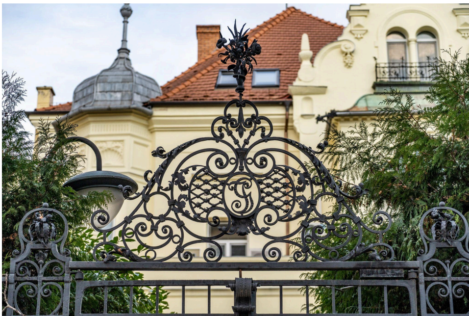
A Jungfer-villa a Városligeti fasor 20. szám alatt, a díszes kerítésen jól kivehető a JG monogram