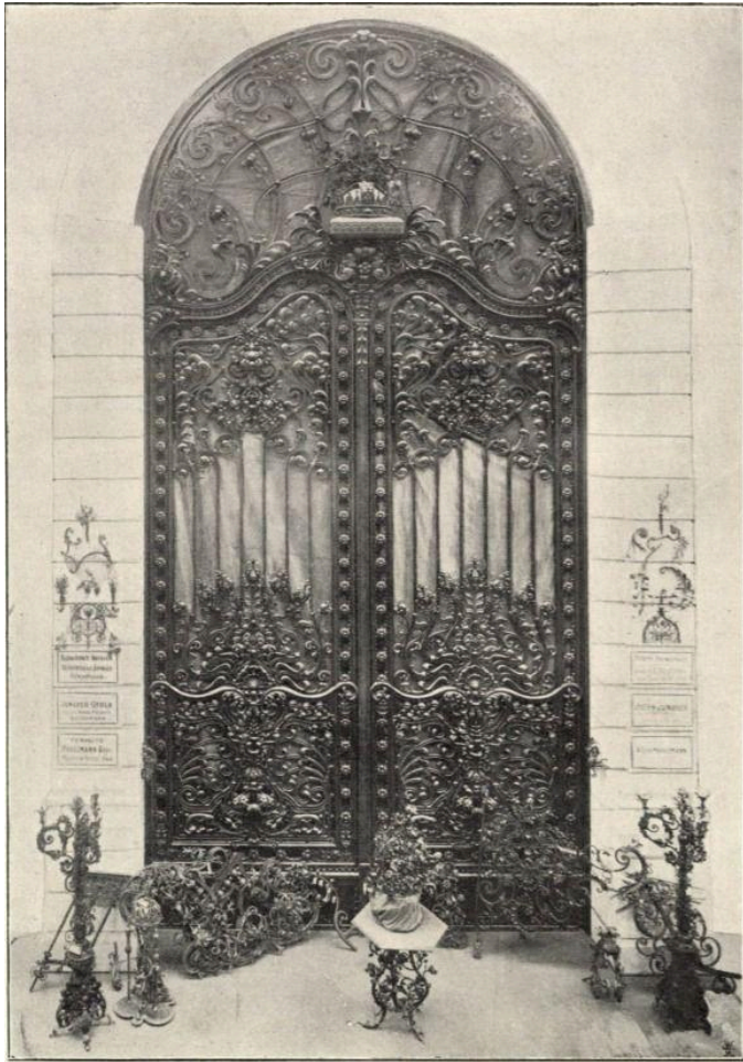
A királyi palota rácsos díszkapuja a II. világháborúban megsemmisült