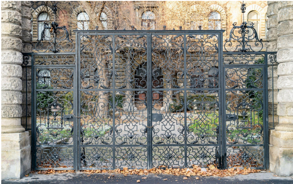
A MÁV Nyugdíjintézete egykori bérpalotájának kerti díszkapuja, Andrásy út 88-90.

Banképületekhez készült vasmunkái sorából kiemelkedő a Magyar Általános Takarékpénztár (V. kerület, József Attila utca 6.) napraforgókkal díszített kapuja, a Magyar Leszámítoló és Pénzváltó Bank (V. kerület, Dorottya utca 6.) és a Magyar Országos Bank (V. kerület, Nádor utca 4.) műlakatos alkotásai.