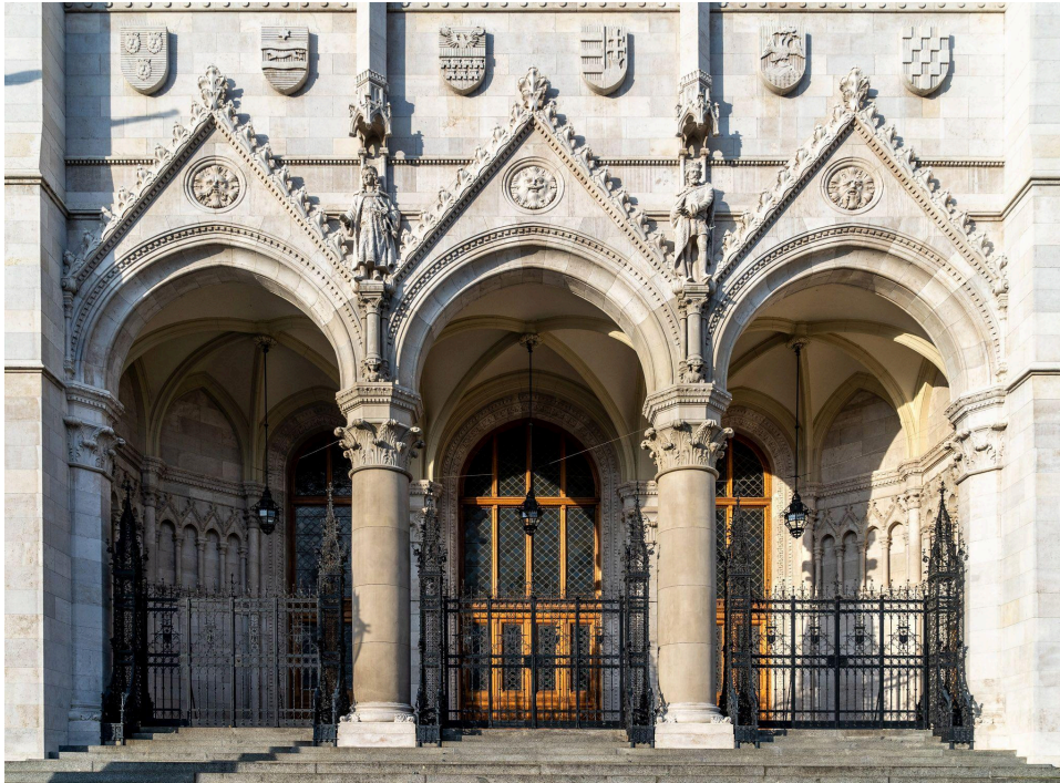
Az Országház főkapuja