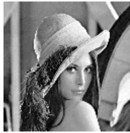
Gambar 1 Citra lena.bmp

Semua tabel dan gambar yang anda masukkan dalam dokumen harus disesuaikan dengan urutan 1 kolom atau ukuran penuh satu kertas, agar memudahkan bagi reviewer untuk mencermati makna gambar.