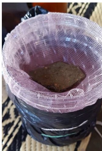
Gambar 1. Ecovitraps dalam rumah

Gambar yang dicantumkan pada naskah harus dengan kualitas yang baik. Gambar tidak berdiri sendiri dan harus merupakan bagian yang relevan dari naskah. Agar diperhatikan bahwa gambar bukan merupakan dokumentasi yang tidak terkait dengan pembahasan naskah. Patikan naskah tidak menampilkan gambar yang menunjukkan identitas maupun afiliasi para penulis.