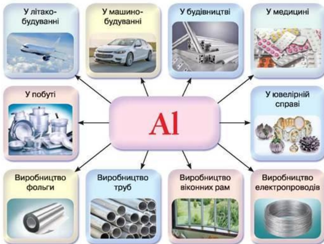
Рис. 49. Схема застосування алюмінію

Сплави — це системи, утворені з двох або більше компонентів (металів з металами або металів з неметалами). Основою для виготовлення сплавів є залізо й алюміній, хром і мідь, магній та титан. З неметалів — бор, кремній та вуглець. Є також сплави розчини, сплави механічні суміші й сплави, у яких речовини реагують одна з одною з утворенням інтерметалідів.