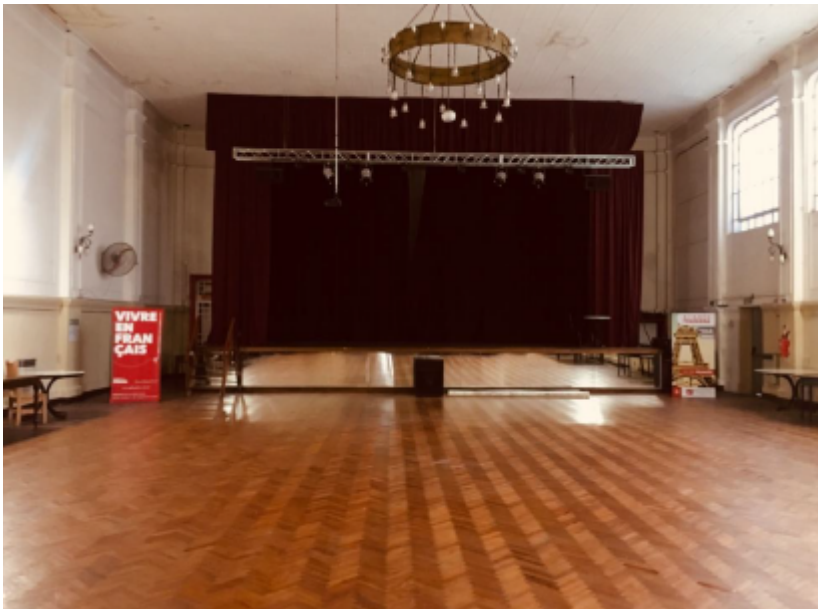
Imagen y plano

2. Es fundamental que cualquier tipo de evento respete un volumen sonoro que permita tener una conversación sin levantar la voz (80 decibeles).