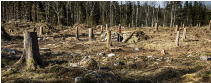
Na Hannibals doortocht

Vervolgens maken soldaten, die erop afgestuurd waren om de rotswand begaanbaar te maken, waarlangs als enige/alleen een weg mogelijk was , omdat rots moest worden uitgehakt , een geweldige stapel (van stukken) hout, nadat in de rondte reusachtige bomen waren geveld en van takken ontdaan, en ze steken deze aan , toen ook een krachtige wind was opgestoken geschikt om vuur te maken, en ze doen de brandende rotsen barsten met eroverheen gegoten azijn/door er azijn over te gieten.