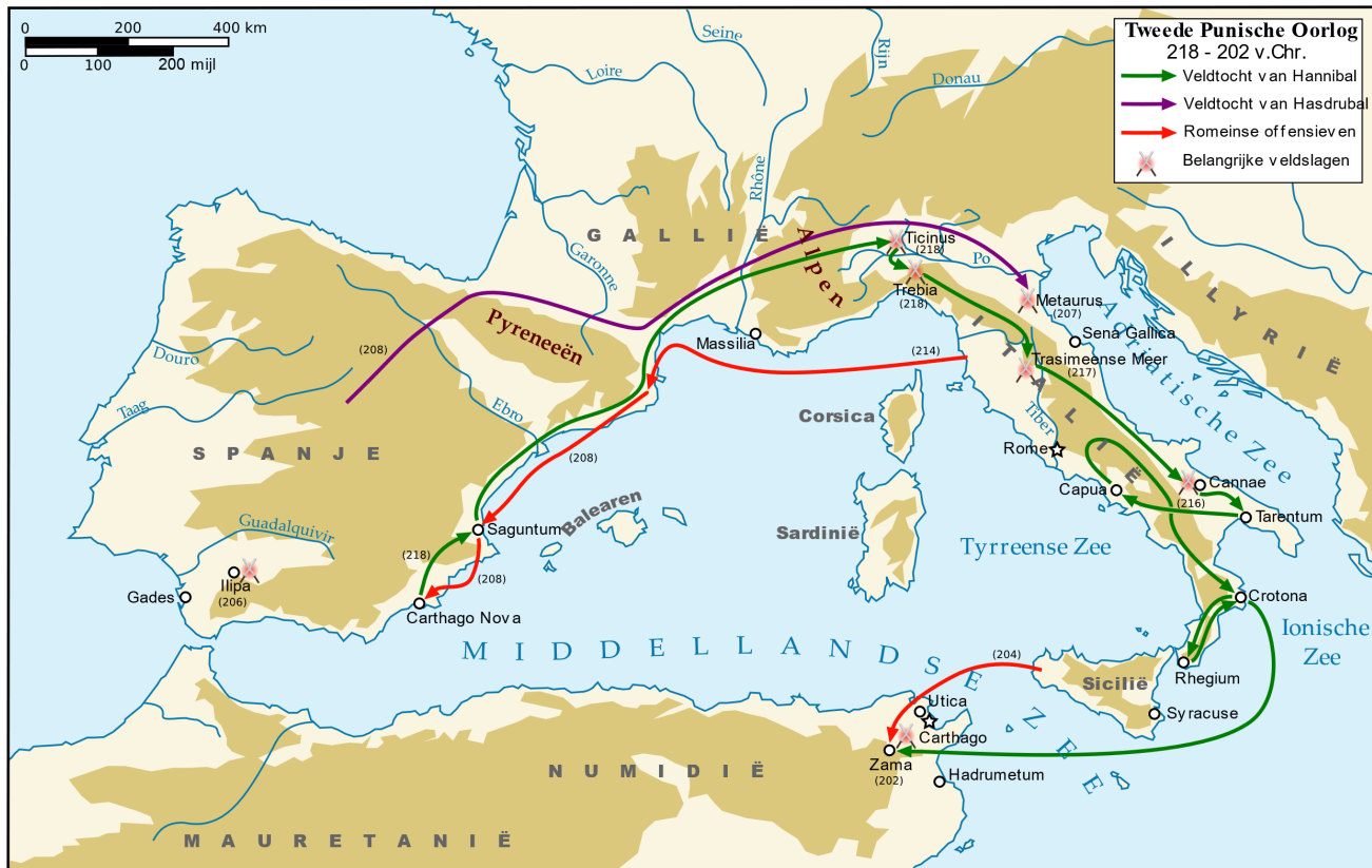
Wikipedia over de tweede Punische oorlog