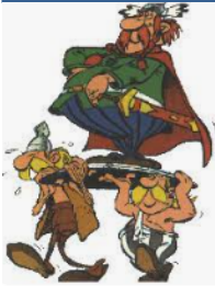
Scipio op het schild gehesen?

Vervolgens bevolen om tot stemming over te gaan hebben niet alleen alle centuriën, maar ook alle mensen tot op de laatste man GOEDGEKEURD DAT het opperbevel in Spanje aan Publius Scipio toekwam. Maar zodra, nadat dit gebeurd was/na de afhandeling van de zaak, de impulsiviteit en hartstochtelijkheid al gekalmeerd waren , is er plotseling een stilte ontstaan en een zwijgende overweging wat zij toch hadden gedaan ; ze vroegen zich af of de sympathie niet sterker was geweest dan de rede.