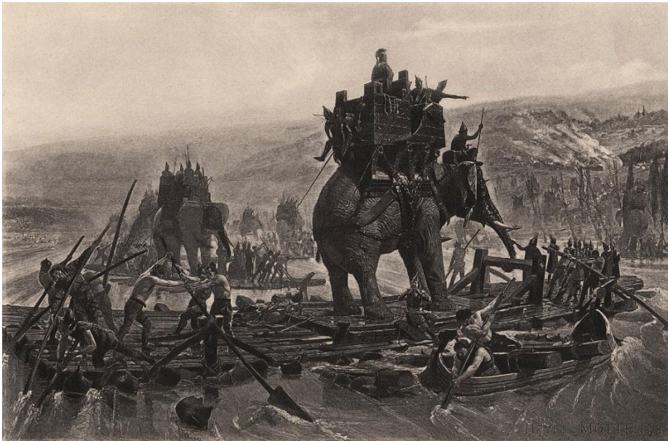
Door Henri-Paul Motte

ik de kust van Gallië voorbijvoer met mijn schepen, nadat ik aan land was gegaan bij het vernemen van het gerucht over deze vijand, ben ik opgerukt naar de Rhône, nadat ik de ruitery vooruit had gestuurd.