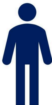
Представитель юридического лица