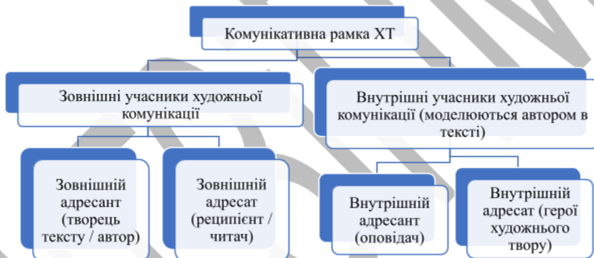
Рис. 1.1. Комунікативна рамка ХТ